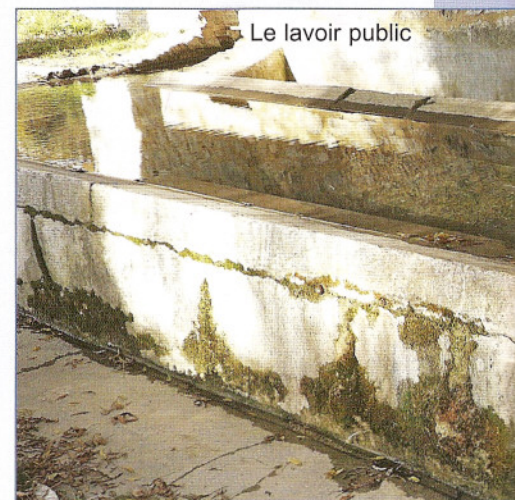
Le lavoir public

par les empereurs Antonin, non entretenues depuis déjà longtemps, n'étaient que des chemins praticables aux seuls chevaux et mulets. La civilisation romaine moribonde existait encore dans les villes, mais la Lussanenque vivait déjà dans une sorte de vase clos, où de grandes propriétés se constituaient peu à peu au détriment d'une population écrasée d'impôts, qui ne pouvait que vendre ses terres ou les abandonner, pour vivre sous l'autorité et la protection d'un riche propriétaire, devenu un « sénior », un seigneur. Au confluent de l'Aiguillon et du Derros, s'était constitué un grand ensemble agricole, un « pagus » dont quelques traces existent encore après le passage des charrues. C'était une « villa ». Assez vite, le sénior, plus en contact avec Nîmes ou Uzès se convertit au christianisme. Il fit venir