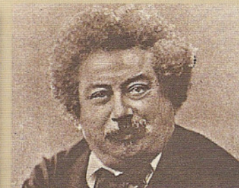
Quand l'aventure conservait ses droits