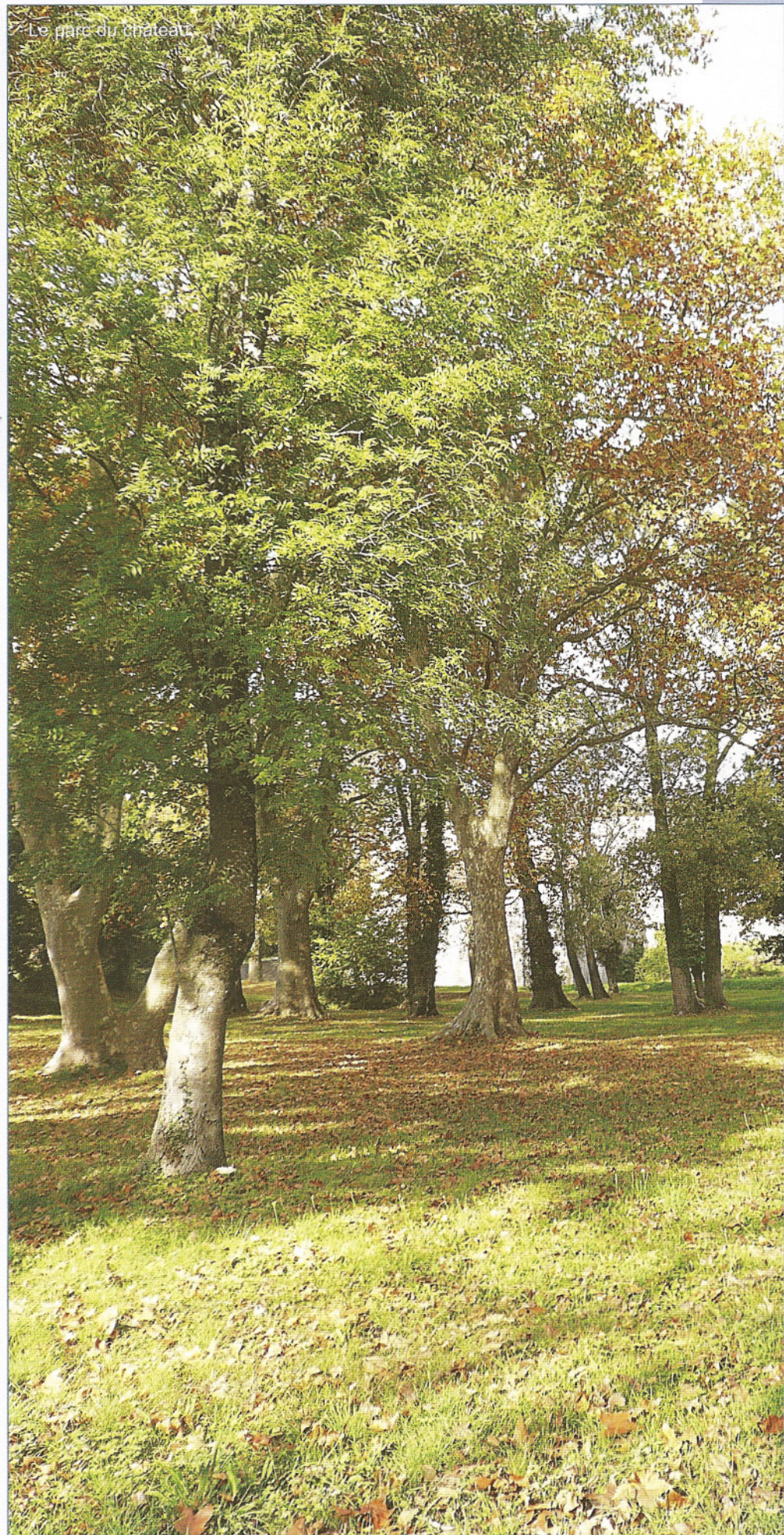
Le parc du château.

Regardons-la de près: Elle porte une robe longue tombant jusqu'au pied, le « péplum ». Le bras droit, dont la main a disparu, rejette un angle d'étoffe sur l'épaule gauche où il retombe avec élégance. Un geste gracieux du bras gauche soutient un pli du péplum à hauteur de poitrine. Ce pan est ainsi relevé; il dégage le genou gauche, légèrement replié donnant l'attitude dite de la « jambe libre ». La jambe droite, elle, porte l'ensemble du corps. Par voie de conséquence, l'épaule droite est plus haute que la gauche. Les plis du péplum dissimulent le pied droit. Un manteau, « l'himation » cache en partie les épaules, le dos et descend presque aux pieds. Hélas, la tête manque, une main aussi; il nous est donc difficile de dater notre nymphe avec un peu de précision. Tout ce qu'il est possible de dire, c'est que l'élégance du mouvement des deux bras, la chute simple et noble de la retombée du tissu sur le