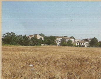
Le canal d'Alais à Aigues-Mortes