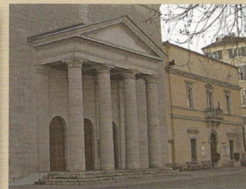
De la porte des Cévennes à l'enfer de Dora